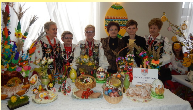
17 marca w Będkowie odbył się XV Powiatowy Konkurs PisaneK i Palm Wielkanocnych w Będkowie.