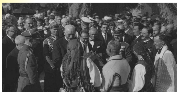
Powitanie Pana Prezydenta Ignacego Mościckiego podczas otwarcia Domu Ludowego w Królowej Woli