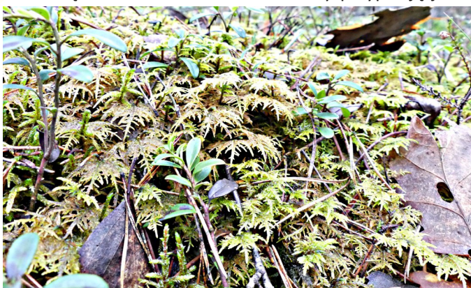
Fot. Gajnik lśniący - gatunek pod ochroną, dość często spotykany w wilgotnych lasach na naszym terenie

kwaśnych torfowiskach, pod wodą czy na litych piaskach. Są organizmami pionierskimi i mało wymagającymi. Jako pierwsze pojawiają się na przykład na wypiętrzonych górskich szczytach, wychodniach skał, gołoborzach, polach lawy. Są bardzo odporne na niekorzystne warunki atmosferyczne. Poprzez swoją obecność tworzą zaczątki gleby, związków mineralnych niezbędnych do życia dla roślin wyższych. Ich zdolność do kruszenia skał jest wręcz niebywała. Jeszcze do niedawna porosty uznawano za oddzielną grupę zaliczaną do roślin. Obecnie naukowcy przypisują je do