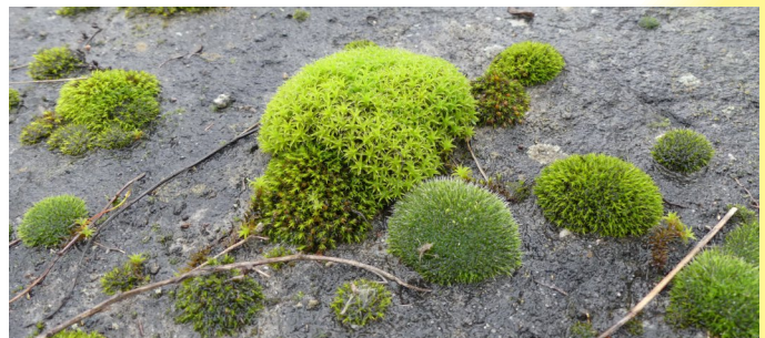
Fot. Mszaki to gatunki pionierskie porastające sztuczne betonowe budowle

Puszcza Pilicka, a zwłaszcza okolice Konewki, Królowej Woli stały się miejscami gdzie spotkać można ostatnie w Polsce środkowej porosty rzadkich gatunków z grupy listkowych. Najczęściej spotykana jest brodaczka kępkowa. Świadczy to o dość dobrej jakości powietrza tych okolic. Innymi gatunkami rzadko już występujących porostów są chrobotki. Najczęściej spotkać je można na suchych wydmach porośniętych ubogimi lasami sosnowymi. Taki typ siedliska lasu nazywa się nawet borem chrobotkowym i jest siedliskiem o znaczeniu wspólnotowym chronionym przez Unię Europejską w ramach tzw. Dyrektywy Siedliskowej. Dobrze zachowane płaty spotkać można pod Brzustowem, w Poświętnym, na Fryszerce czy na południe od Inowłódza. Elementem sprzyjającym występowaniu mszaków i porostów są stare murki, skały, umocnienia, nieotynkowane elewacje. Gmina Inowłódz z racji