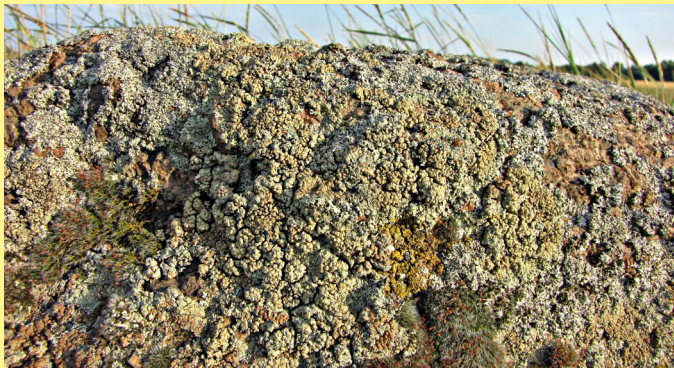
Fot. Bogactwo porostów i mszaków porastających głaz narzutowy okolic Brzustowa

Jednym z podstawowych wskaźników jakości środowiska jest obecność w naszym otoczeniu organizmów o prostej strukturze i budowie. Do takich zaliczyć można mszaki czy porosty. Występują one w najrozmaitszych środowiskach, zajmują często miejsca bardzo niegościnne czy wydawać mogło by się jałowe. Można je spotkać na nagich skałach, które jako jedyne stworzenia porastają, w cienistych dnach lasów,