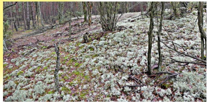
Fot. Klasyczny przykład boru chrobotkowego - Fryszerka

królestwa grzybów. Trudno w to uwierzyć patrząc na ich niezwykle ciekawe formy, kształty listkowe, krzaczkowe i skorupiaste. Jest zagadką ewolucji jak powstały, ale tworzą je właściwie dwa odmienne typy organizmów. Każdy porost składa się bowiem z grzyba i glonu. Głon w procesie fotosyntezy dostarcza niezbędne cukry, natomiast grzyb wnosi wkład w ten związek jako dostarczyciel związków mineralnych i stabilizację do podłoża. Dopiero wówczas jako jeden już organizm, mogą dalej trwać w koniecznej nieco symbiozie. Jeszcze 100 lat temu nasze lasy pełne były porostów występujących w formie listkowej. Na drzewach wszędzie dominowały długie zwisające kępy brodaczek, włostek. Na pniach drzew spotkać można było rozległe plechy graniczników, pawężnic. Niestety gwałtowne