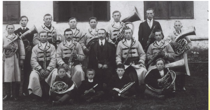
Orkiestra włościańska z Królowej Woli – 1917 rok