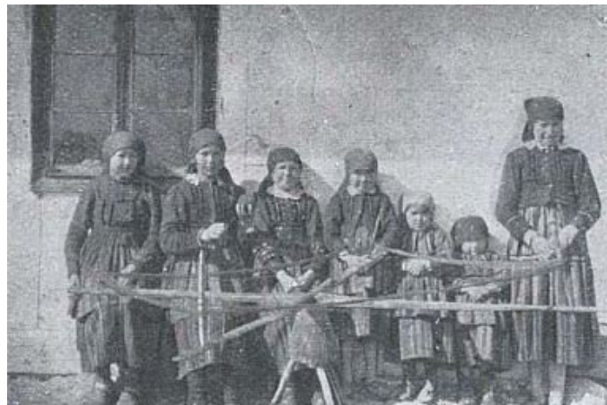
Wyrób lnu przez kobiety z Królowej Woli

Księstwo Łowickie po trzecim rozbiórce stało się własnością państwa pruskiego, a w czasach napoleońskich (w roku 1807), cesarz obdarował nim swojego marszałka Louisa Davouta. Później weszło w skład Królestwa Polskiego i decyzją cara Aleksandra I z dnia 22 czerwca 1829 roku Księstwo Łowickie, a w raz z nim lasy spalskie stały się własnością księcia Konstantego i jego drugiej żony księżnej Joanny Grudzińskiej. W tym okresie przeprowadzono oczyszczanie chłopów na ziemiach Księstwa, co przyczyniło się do wzrostu zamożności chłopów na tym terenie. Choć 20 listopada 1831 roku Grudzińska, księżna łowicka zapisała swoje dobra przyszłemu królowi polskiemu to testament ten pozostał niezrealizowany, a Księstwo Łowickie – a w raz z nim Królowa Wola – pozostało bezpośrednią własnością carów do wybuchu I wojny światowej.