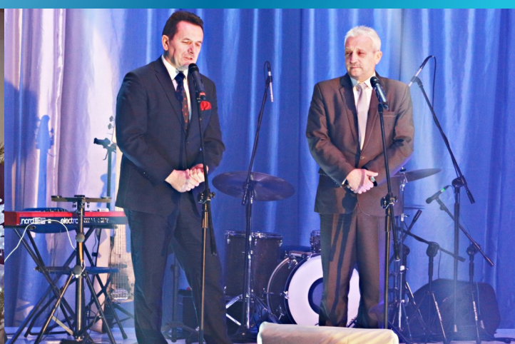
XIV Powiatowe Spotkanie Noworoczne organizowane przez Gminę Inowłódz i Powiat Tomaszowski - str. 10