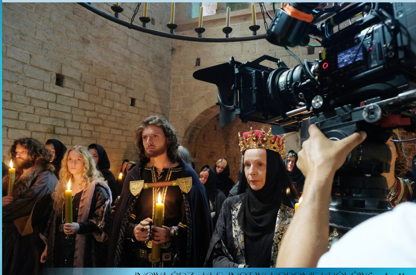
INOWŁÓDZ - KLEJNOT W „KORONIE KRÓLÓW” - str. 11

INFORMATOR SAMORZĄDOWY nr 31 styczeń / luty 2018